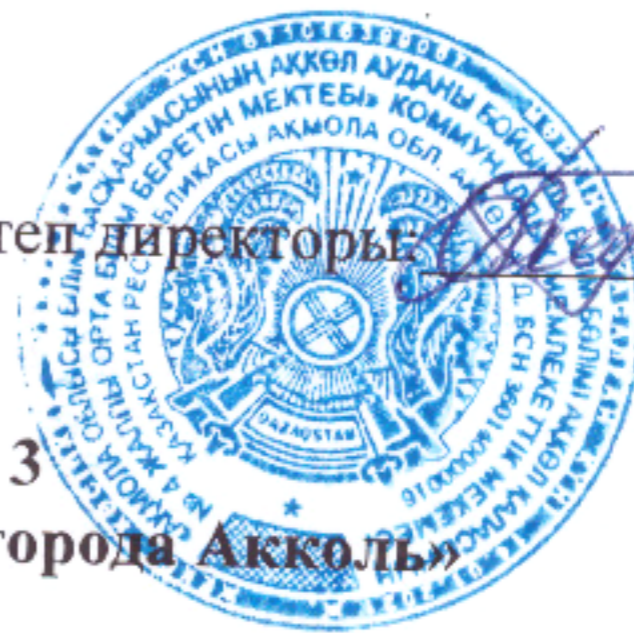
График проведения СОЧ – 3 КГУ «Общеобразовательная школа № 4 города Акколь» (2025-2026 учебный год)