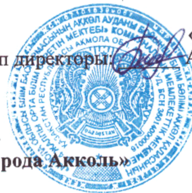
График проведения СОЧ – 4 КГУ «Общеобразовательная школа № 4 города Акколь» (2025-2026 учебный год)