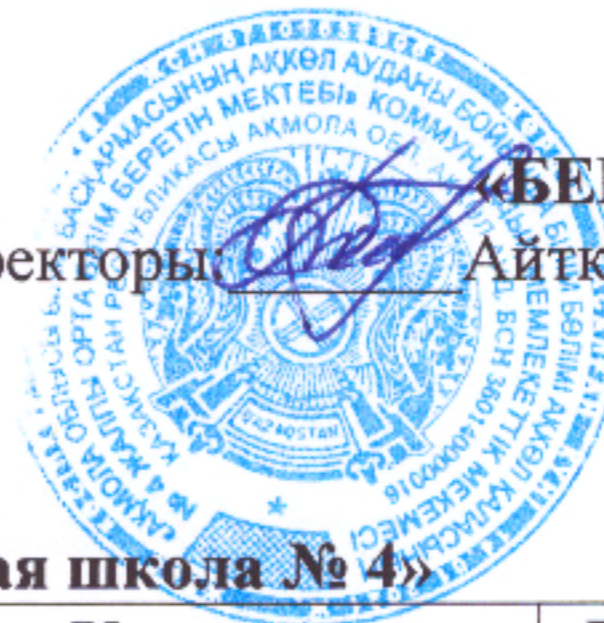
График проведения СОЧ – 2 2025 – 2026 учебного года КГУ «Общеобразовательная школа № 4»