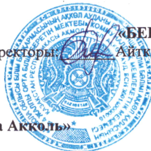
График проведения СОЧ – 4 КГУ «Общеобразовательная школа № 4 города Акколь» (2025-2026 учебный год)