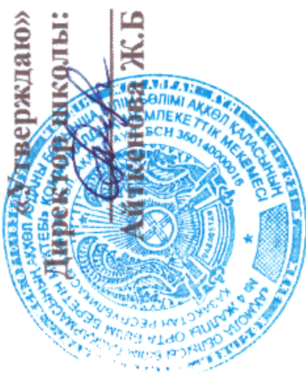
График проведения Соч 4 в КГУ «Общеобразовательная школа № 4 в 3-х классах