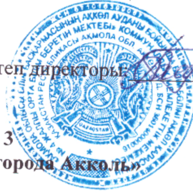
График проведения СОЧ – 3 КГУ «Общеобразовательная школа № 4 города Акколь» (2025-2026 учебный год)